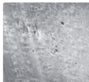
Cuscinetto più liscio dopo l'uso dell'olio Royal Purple con Synerlec.*

* Stesso cuscinetto dello stesso motore, ingrandito di 1500x